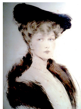
Paul-César Helleu « Elegante au chapeau »