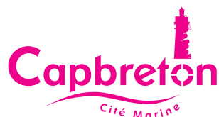
Utilisation d'une couleur en dehors de celles de la charte