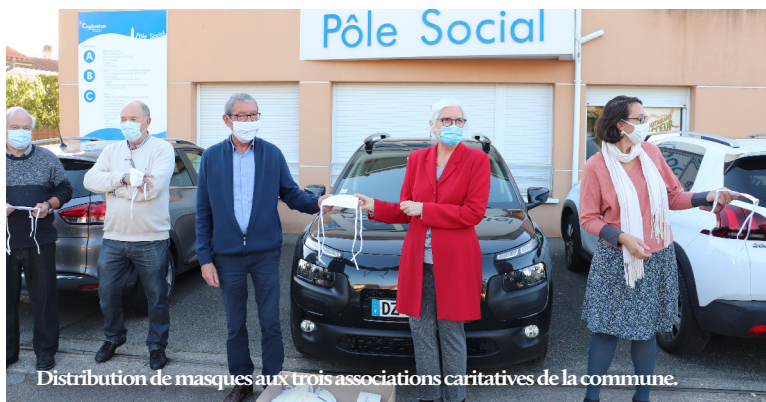
Distribution de masques aux trois associations caritatives de la commune.

Afin de répondre aux besoins des personnes démunies, la Ville et le Centre Communal d'Action Sociale de Capbreton ont remis 1500 masques aux Restos du Coeur, au Secours Populaire Français et au Secours Catholique. Merci aux associations pour leur mobilisation et leur engagement auprès des personnes les plus fragiles.