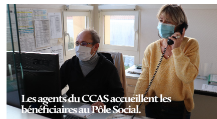
Les agents du CCAS accueillent les bénéficiaires au Pôle Social.

Renseignements et inscriptions au 05 58 72 70 75 - ccas@capbreton.fr Pôle Social : 27 allée du Boudigau