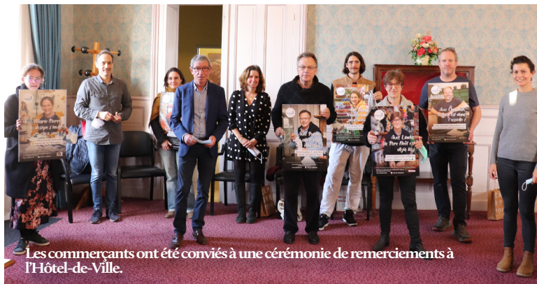
Les commerçants ont été conviés à une cérémonie de remerciements à l'Hôtel-de-Ville.

Elle s'affiche dans toute la commune jusqu'au 31 décembre et se poursuivra sur la page Facebook de la Ville avec la mise en ligne de vidéos d'artisans et restaurateurs locaux.