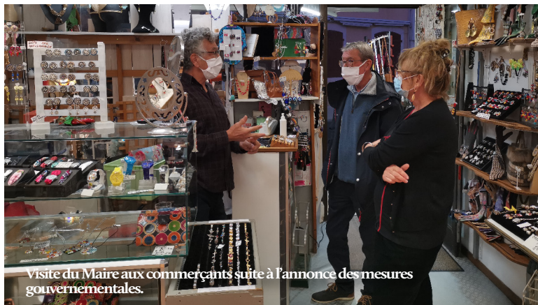
Visite du Maire aux commerçants suite à l'annonce des mesures gouvernementales.

Après un recensement de toutes les initiatives des professionnels locaux, il a été mis en ligne dès le 7 novembre sur le site internet de la Ville et il est régulièrement actualisé depuis cette date. Il a également été distribué dans les boîtes aux lettres de tous les Capbretonnais.