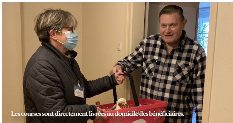
Les courses sont directement livrées au domicile des bénéficiaires.

Dès le reconfinement fin octobre, la Ville et le CCAS ont réactivé tous les dispositifs de soutien spécifiques aux personnes les plus fragiles et vulnérables. Portage de repas, livraison de courses quotidiennes à domicile dès le début du mois d'octobre, soutien téléphonique aux personnes isolées avec les associations caritatives : autant de mesures destinées à renforcer le lien social pendant cette période exceptionnelle.