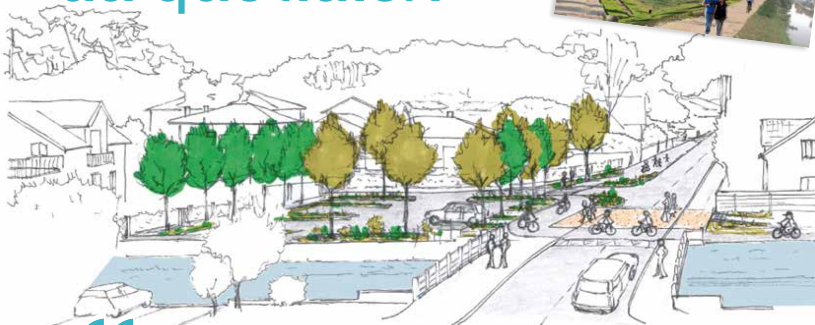
Place des Déportés et avenue Georges-Clemenceau (pont de la Halle)