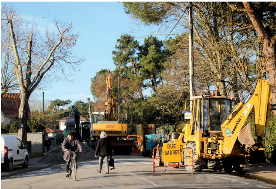
Travaux avenue Georges-Clémenceau.

La prochaine étape concerne le choix des végétaux et des aménagements. Avec, en parallèle, le chiffrage du projet qui doit rester dans l'enveloppe définie. J'assurerai ensuite le suivi des travaux.