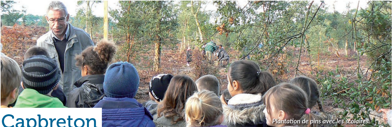
Plantation de pins avec les scolaires.