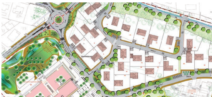
Plan du lotissement Les Deux Pins avec l'Ehpad et le futur rond-point.

Le nouveau lotissement Les Deux Pins avance, de même que le projet d'Ehpad, dont le permis de construire sera déposé courant février. En parallèle, la commune a prévu la création d'un rond-point pour desservir et sécuriser les lieux.