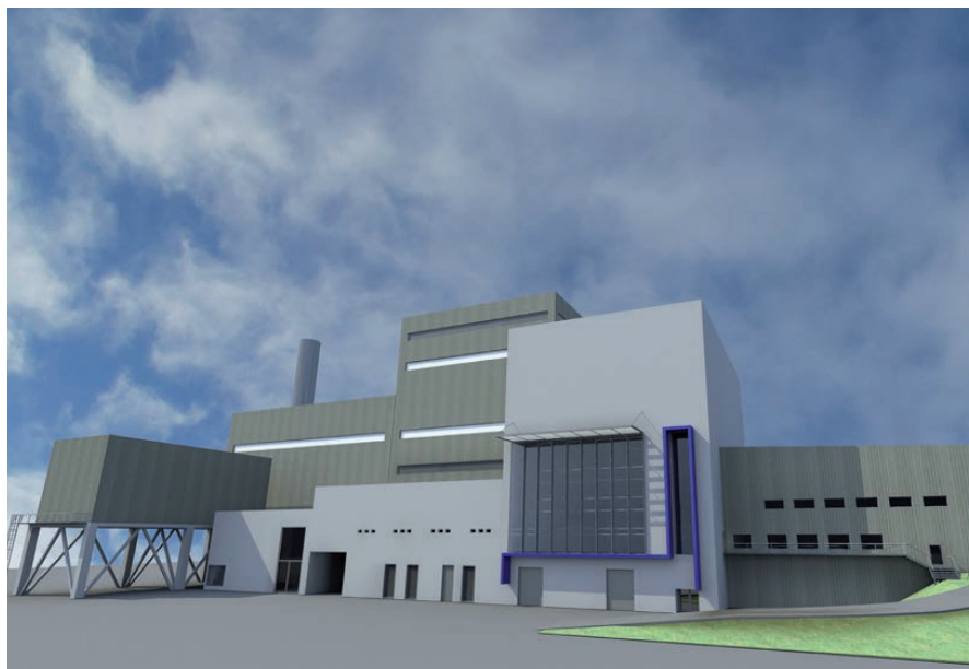
La future Unité de valorisation énergétique.

Une partie des déchets ne peut être ni recyclée, ni valorisée. Depuis 1972, le Sitcom Côte Sud des Landes, qui regroupe 76 communes, les incinère dans deux unités. Une nouvelle étape est prévue pour le printemps 2016 : récupérer l'énergie produite par la combustion des déchets.