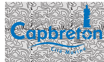
Utilisation sur fond perturbé