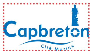
Non respect de la zone de protection

Pour être conforme, le logo de la Ville de Capbreton doit être construit selon les règles énoncées précédemment. Toute autre forme de représentation est interdite, comme le démontrent les exemples exposés ci-dessous.