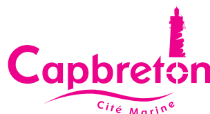
Utilisation d'une couleur en dehors de celles de la charte