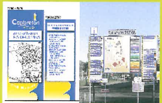
Signalétique de la zone artisanale : l'ancienne (à droite) et la nouvelle, plus claire (à gauche)

Une signalisation particulière sera mise en place dans l'enceinte du complexe sportif (conciergerie, dojo, école de cirque, terrain de rugby, de foot, piste d'athlétisme...).