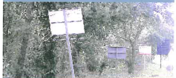
Les nuisances visuelles en entrée de ville sont amenées à disparaître

Cela veut dire que dès que la nouvelle signalisation sera en place, les services compétents (DDE et Services techniques municipaux) pourront recenser les panneaux illégaux et mettre leurs propriétaires en demeure de procéder à leur enlèvement".