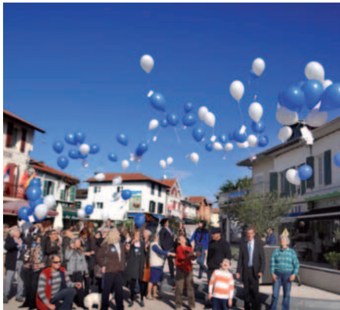
L'antenne départementale de l'Association pour le Droit de Mourir dans la Dignité a organisé un lâcher de ballons biodégradables en conclusion de sa réunion publique.