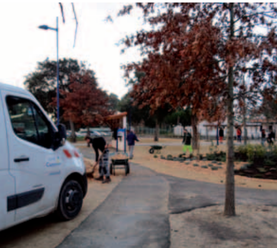
Aménagement des espaces verts devant le groupe scolaire Saint-Exupéry