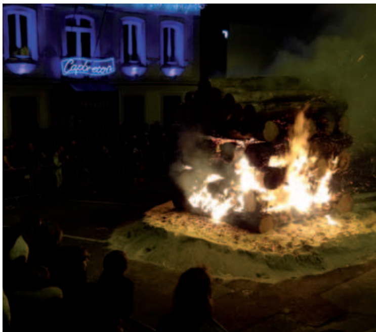
Il y avait foule, le soir de Noël, pour le traditionnel embrasement de la Torèle.