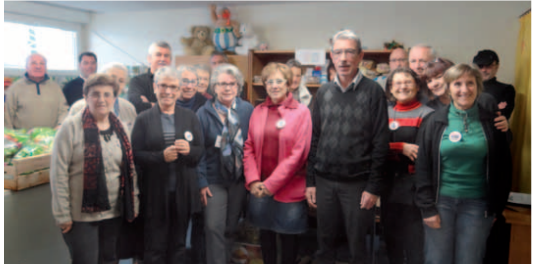
L'équipe des Restos du cœur distribue un nombre croissant de repas tous les hivers

Les associations caritatives capbretonnaises apportent une assistance bénévole aux personnes en difficulté, en collaborant avec le Centre Communal d'Action Sociale.