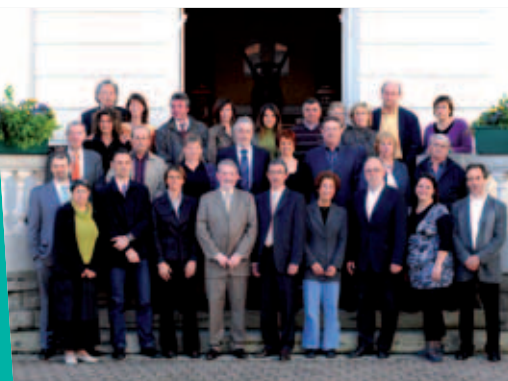
Le conseil municipal en mars 2008

La commune est dotée d'une organisation propre, qui comprend une autorité délibérante, le Conseil municipal et une autorité exécutive : le maire et les adjoints.