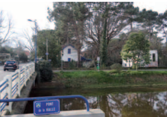
Site du futur jardin public

Un nouvel espace vert et de loisirs sera aménagé en plein centre-ville, rue Georges-Clémenceau. En effet, le Conseil municipal a souhaité se porter acquéreur d'une parcelle de 2033m 2 , située à deux pas de la mairie, le long du Boudigau et de la voie verte. Son prix a été estimé à 340 000€. Laisse jusqu'à présent à l'abandon, après qu'un projet d'immeuble a été refusé par l'architecte des bâtiments de France et par la commission urbanisme, ce terrain va connaître une nouvelle vie. Il s'intégrera dans le schéma général de réhabilitation du centre-ville.