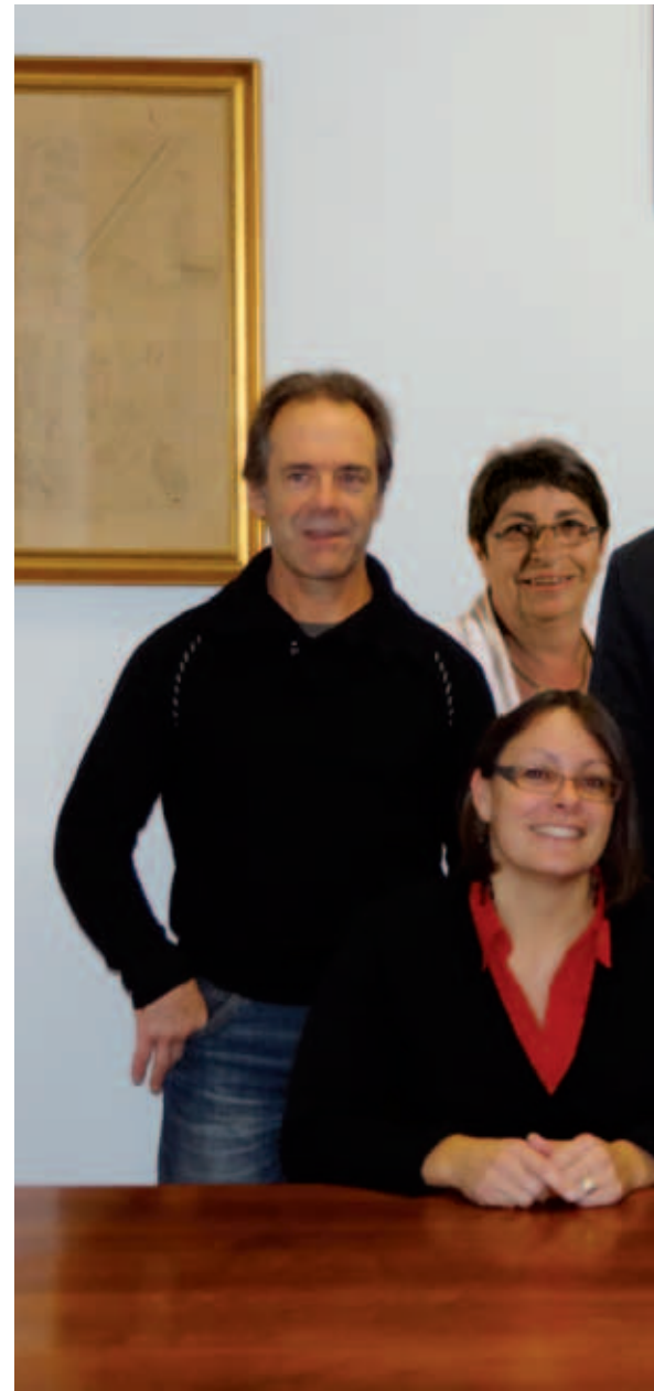
Le maire entouré de ses adjoints

chercheur au CNRS 1 er adjoint délégation : Urbanisme, Intercommunalité et Nouvelles Technologies