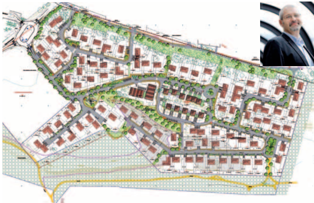
Tous les types d'habitat seront représentés

Le permis d'aménager du futur lotissement des 2 Pins, situé route de Soorts, est lancé. Explications avec Eric Kerrouche, 1 er adjoint en charge de l'urbanisme.