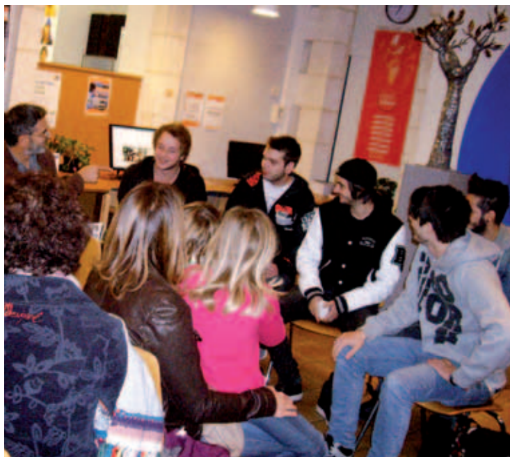
Rencontre à la médiathèque avec le groupe de rock biarrot Eskemo autour du manga officiel de leur album.