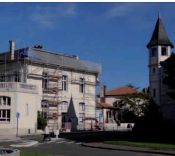
Réfection de la toiture de l'Hôtel-de-Ville