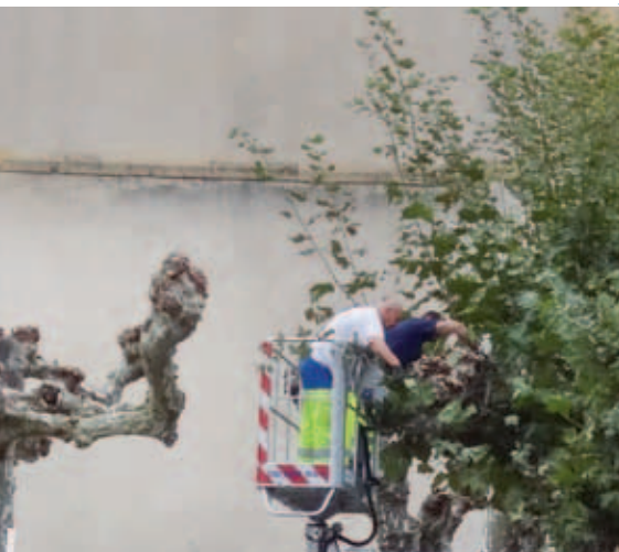
Élagage des platanes entre l'église et la mairie