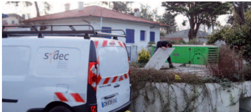
Les agents du Sydec sont sur le terrain depuis début janvier

Trois millions d'euros vont être affectés à la rénovation et à l'amélioration du circuit de distribution d'eau potable et de collecte des eaux usées.