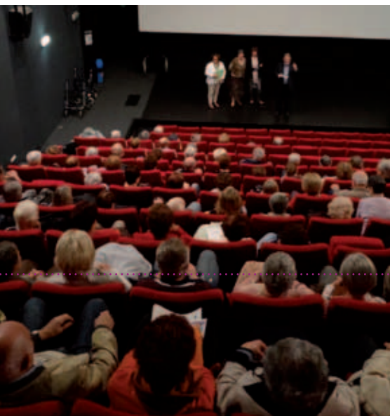
Projection du film « Les Intouchables » au cinéma municipal Le Rio

La Semaine Bleue a eu un tel succès (plus de 700 inscriptions au total), que les élus du CCAS, organisateur, ont décidé de doubler les animations proposées.