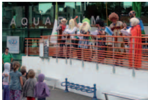
En 2012, les textes sélectionnés ont fait l'objet d'une lecture publique et déguisée

Créé en 2003, Paroles citoyennes est un concours d'écriture et de créations plastiques. En lien avec l'ouverture de la maison de l'oralité et du patrimoine (MOP) pré-