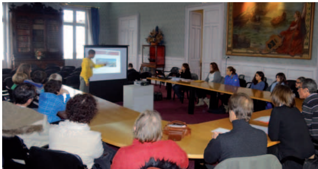
Les équipements du skate-park à venir ont fait l'objet d'études attentives

Les élus du Conseil municipal des enfants s'investissent très sérieusement dans l'avancée de leurs projets.