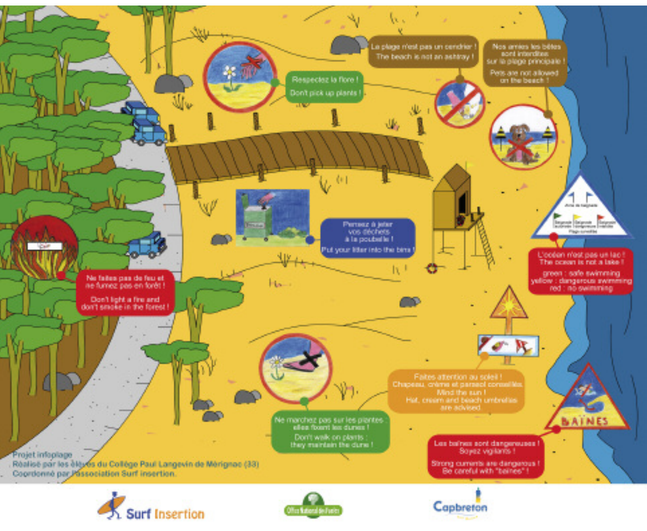
Le respect de quelques règles permet de protéger l'environnement et la santé de tous