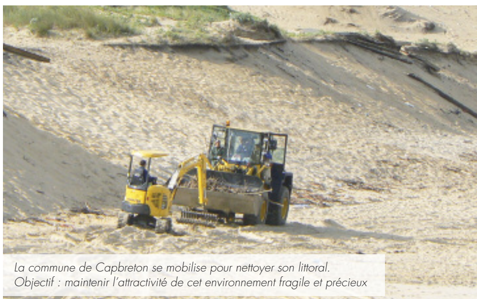
La commune de Capbreton se mobilise pour nettoyer son littoral. Objectif : maintenir l'attractivité de cet environnement fragile et précieux

Le Conseil général des Landes conduit, en partenariat avec les quinze communes littorales, un nettoyage systématique de la côte. Cette opération fonctionne toute l'année depuis plus de quinze ans.