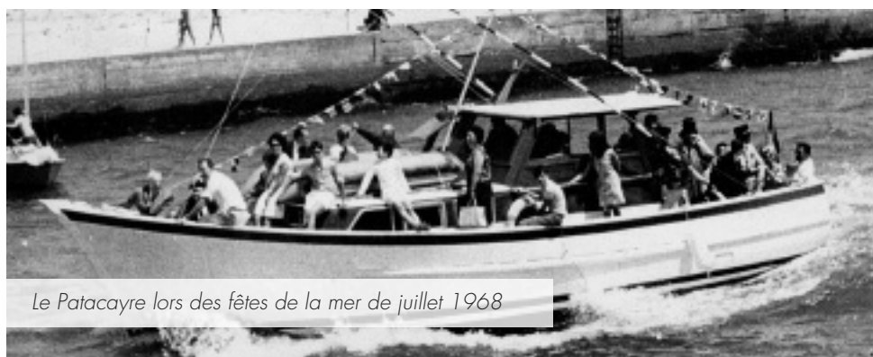
Le Patacayre lors des fêtes de la mer de juillet 1968