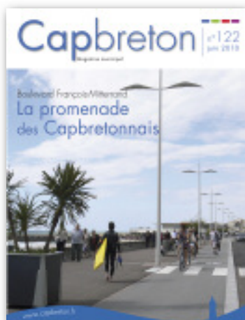
"Promenade des Capbretonnais", piétons, cyclistes et automobilistes, chacun a sa voie sur le boulevard François-Mitterrand

→ Comme annoncé, le boulevard François-Mitterrand sera agrémenté de trois belvédères l'été prochain. Le programme immobilier privé avec thalassothérapie doit démarrer après l'été.