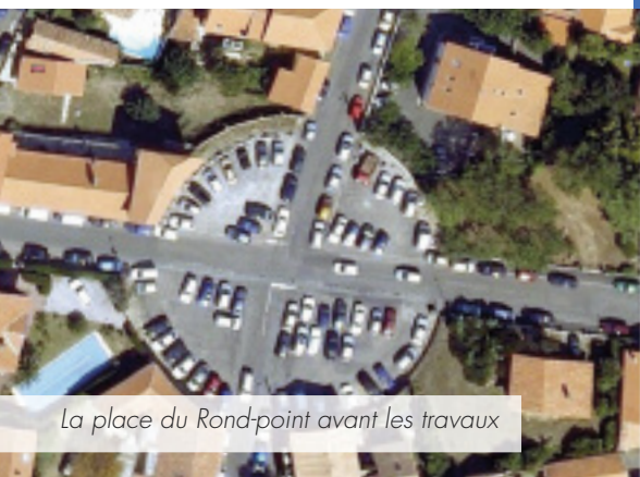
La place du Rond-point avant les travaux

Avant les travaux, la place du Rond-point était un lieu de stationnement anarchique, dangereux pour les véhicules et les piétons, difficilement accessible aux personnes handicapées et mal éclairé. La construction d'îlots et le renforcement de la signalisation ont sécurisé le carrefour. Quatre parkings avec une place "handicapé" ont été créés et les espaces piétons mis en conformité.