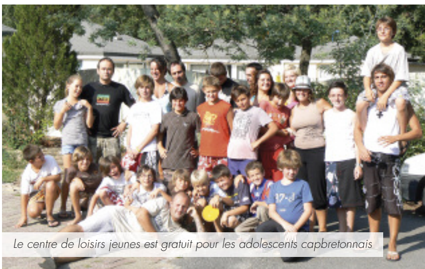
Le centre de loisirs jeunes est gratuit pour les adolescents capbretonnais

Comme chaque été, le pôle enfance jeunesse vie associative et sports de la mairie propose de nombreuses activités :