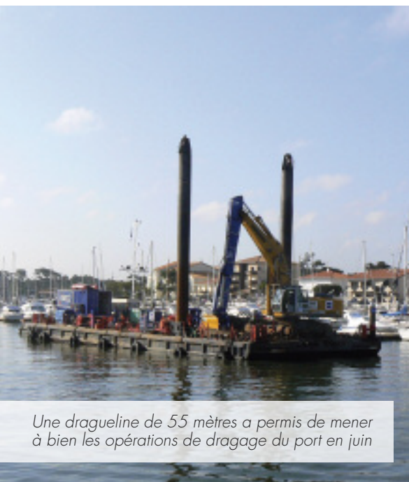
Une dragueline de 55 mètres a permis de mener à bien les opérations de dragage du port en juin