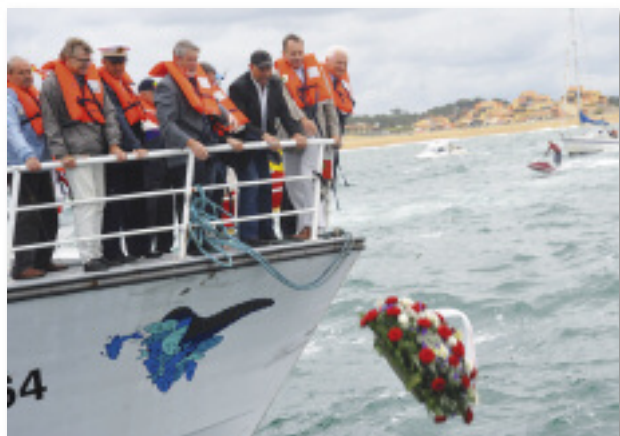
Le jet de la couronne bénie par le prêtre symbolise l'hommage rendu aux marins pêcheurs