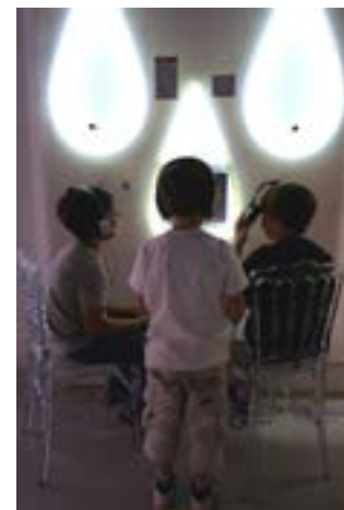
À la découverte des légendes de Capbreton

Des bornes d'écoute, avec casque et écran, vous proposent une sélection de récits, rassemblés par les Capbretonnais à l'occasion d'une collecte auprès des habitants.