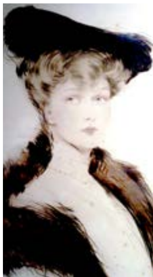
Des œuvres d'art uniques

Paul-César Helleu « Élegante au chapeau »