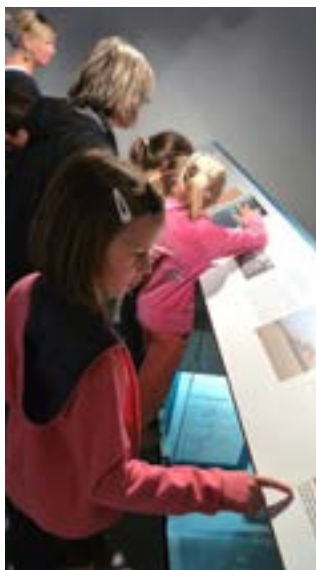
Apprendre en jouant