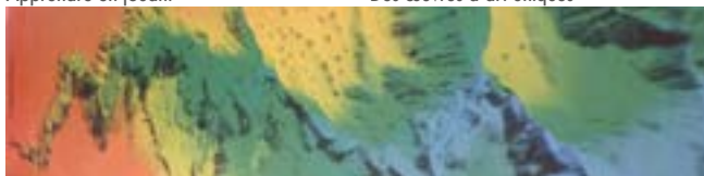
Le gouf en 3D

Paul-César Helleu « Élegante au chapeau »